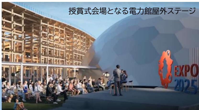
授賞式会場となる電力館屋外ステージ